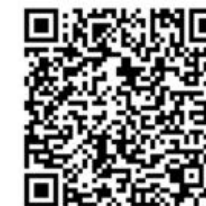
QR - Code